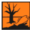
Nebezpečný pro životní prostředí